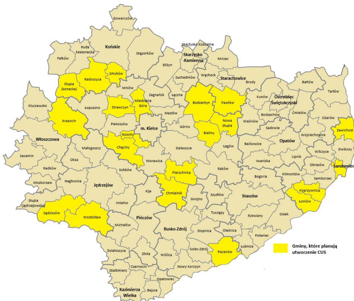
Mapa 2. Gminy, które planują utworzenie CUS w ciągu najbliższych 2 lat (stan na 14.04.2026 r.).

Źródło: Badanie ankietowe I półrocze 2026 roku.